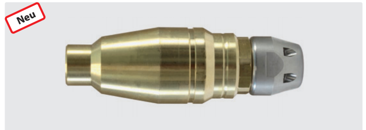
ST-458.1. Max. 400 bar / 100 °C