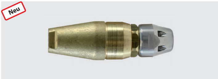
ST-357.1. Max. 250 bar / 100 °C

gerichtete konusförmig rotierende Punktstrahl genügend Reinigungskraft liefert, um sich durch Wurzeln oder Ablagerungen hindurch zu fräsen. Auch ideal zum Zerkleinern von Cellulose oder fetthaltigen Ablagerungen.