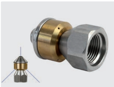
3/8" IG. \varnothing 24 mm. Max. 250 bar