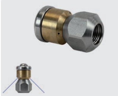
1/8" IG. \varnothing 19 mm. Max. 250 bar