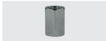
Sechskant. Stahl verzinkt