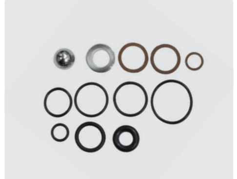
Rep. Kit VB85