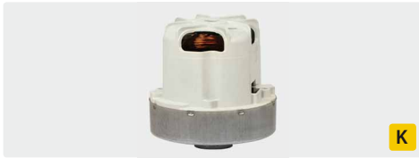
1-stufig. 230 V / 50 Hz. Kabel beigelegt. Mit Thermoschalter