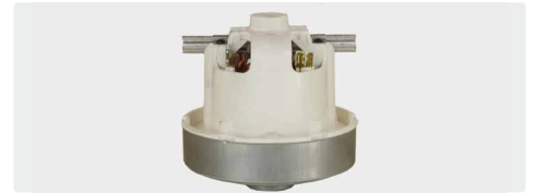
1-stufig. 230 V / 50 Hz. Ohne Kabel, (Kabeltyp 1 optional)