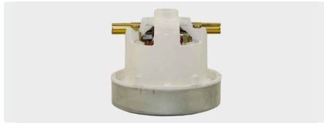
1-stufig. 230 V / 50 Hz. Ohne Kabel, (Kabeltyp 1 optional)