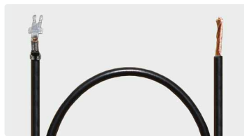
Gabel 3,5 : offen. Kabel 300 mm. Typ 2