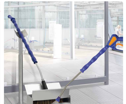
Zweiteiliger Bürstenbehälter mit Reinigungsschlitz. Bodenmontage für verschiedene Waschbürstenlängen.