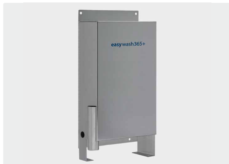
Bürstenbehälter mit Überlauf und seitlichem Abflusstutzen zur Reinigung. Wand- und Bodenmontage. H x B x T = 670 x 340 x 143 mm