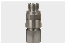
1/2" AG : 1/2" IG. Max. 600 bar