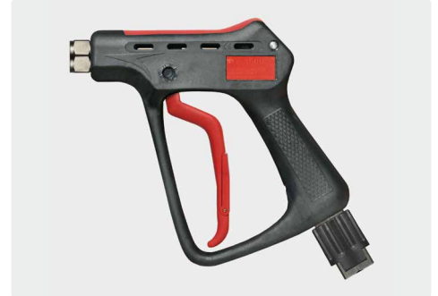
Professionelle Höchstdruckpistole. Max. 600 bar / 80 l/min / 150 °C