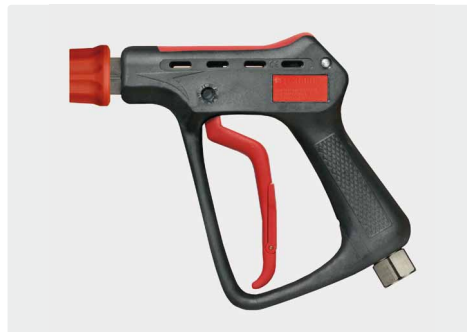
Professionelle Höchstdruckpistole mit Kupplung ST-45. Max. 600 bar / 80 l/min / 150 °C