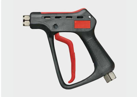
Professionelle Höchstdruckpistole. Max. 600 bar / 80 l/min / 150 °C