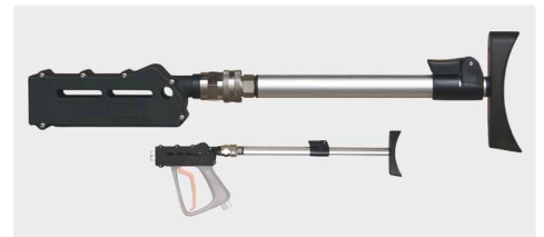
ST-3900 Schulterstützen. Neue EU-Richtlinien schreiben den Gebrauch von Schulterstützen bei Arbeiten mit einer Rückstoßkraft von mehr als 150 N zwingend vor. Stufenlos verstellbare Schulterstütze. Drehbare Kupplung. Geeignet für alle Pistolen ST-3600 / ST-3500.