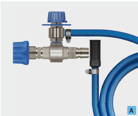
Kupplung ST-45-250 Messing vernickelt : Stecknippel ST-45-250 Edelstahl. Injektor ST-160 mit Dosierventil ST-161, Saugschlauch 2.000 mm und Saugfilter ST-31. Max. 250 bar / 90 °C