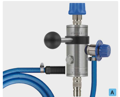
Kupplung ST-45-250 Messing vernickelt : Stecknippel ST-45-250 Edelstahl. Injektor ST-167 mit Dosierventil ST-161, Saugschlauch 2.000 mm und Saugfilter ST-31. Max. 250 bar / 100 °C