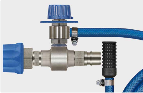
Kupplung ST-45-250 Edelstahl : Stecknippel ST-45-250 Edelstahl. Injektor mit Dosierventil ST-161, Saugschlauch 2.000 mm und Saugfilter ST-31. Max. 250 bar / 90 °C