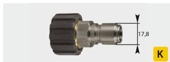
Stecknippel : IG. Edelstahl + Messing. Max. 250 bar / 150 °C