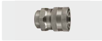
Kupplung : IG. Edelstahl. Max. 250 bar / 150 °C