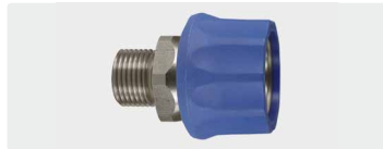
Kupplung : AG. Edelstahl. 60° Dichtkonus. Max. 250 bar / 150 °C