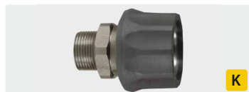
Kupplung : AG. Edelstahl. Max. 250 bar / 150 °C