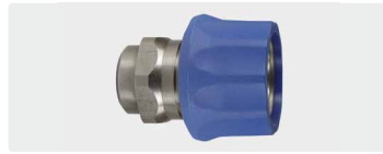
Kupplung : IG. Edelstahl. Max. 250 bar / 150 °C