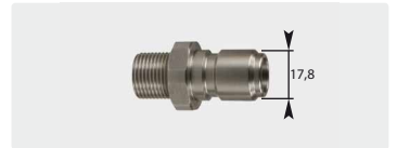
Stecknippel : AG. Edelstahl. 60° Dichtkonus. Max. 250 bar / 150 °C