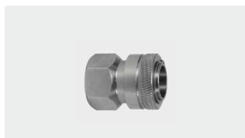
Kupplung : IG. Edelstahl. Max. 150 bar / 90 °C