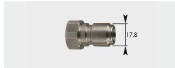
Stecknippel : IG. Edelstahl. Max. 250 bar / 150 °C