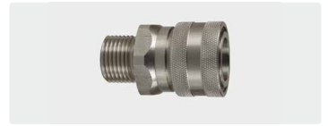
Kupplung : AG. Edelstahl. 60° Dichtkonus. Max. 250 bar / 150 °C