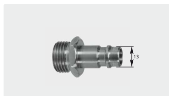
Stecknippel : AG. Edelstahl. Max. 150 bar / 90 °C