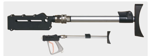
ST-3900 Schulterstützen. Neue EU-Richtlinien schreiben den Gebrauch von Schulterstützen bei Arbeiten mit einer Rückstoßkraft von mehr als 150 N zwingend vor. Stufenlos verstellbare Schulterstütze. Drehbare Kupplung. Geeignet für alle Pistolen ST-3600 / ST-3500.