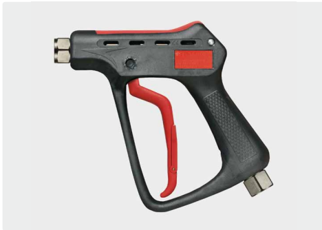
Professionelle Höchstdruckpistole. Max. 600 bar / 80 l/min / 150 °C