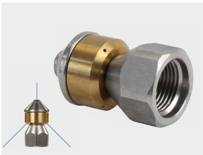
3/8" IG. \varnothing 24 mm. Max. 250 bar