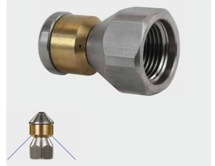
3/8" IG. \varnothing 24 mm. Max. 250 bar