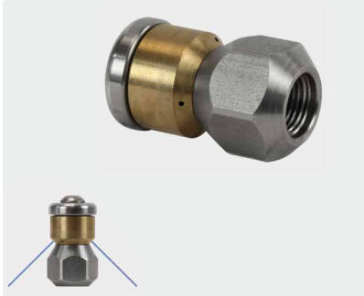
1/8" IG. \varnothing 19 mm. Max. 250 bar