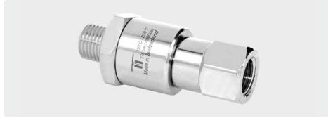
DGV. 1-fach kugelgelagert