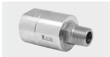
DGE. Gehäuse Messing vernickelt. 1-fach kugelgelagert. Max. 275 bar