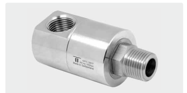
DGEI 90°. Gehäuse Edelstahl. 3-fach gelagert. Max. 350 bar