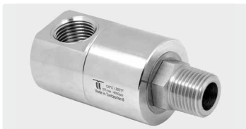
DGE 90°. Gehäuse Messing vernickelt. 1-fach kugelgelagert. Max. 275 bar

Edelstahl. Rost- und wartungsfrei. Anwendungsbereich: Speziell für große Durchflussmengen und kleine Drehzahlen, z. B. bei automatischen Waschanlagen, konzipiert. Max. 30 U/min / 120 °C. DN 13 für 1/2". DN 25 für 1"