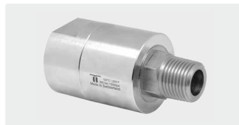
DGEI. Gehäuse Edelstahl. 3-fach gelagert. Max. 350 bar