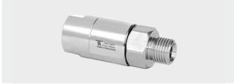
DGS. 2-fach kugelgelagert

Gehäuse Edelstahl / Messing vernickelt. Achse Edelstahl. Rost- und wartungsfrei. DN 6. Anwendungsbereich: Drehgelänke speziell für den Einsatz an Hochdruckpistolen und Schlauchverbindungen, Deckenkreisel in SB-Waschanlagen. Max. 275 bar / 30 U/min / 120 °C