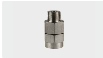
3/8" AG : 3/8" IG. Edelstahl. Max. 500 bar / 90 °C