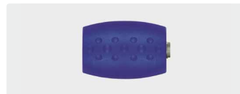
1/4" IG : 1/4" AG. 350 bar. Rostfrei. easywash365+ blau