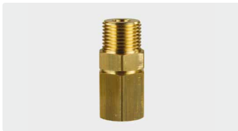
1/2" AG : 1/2" IG. Messing. Max. 250 bar / 90 °C