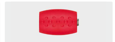
1/4" IG : 1/4" AG. 350 bar. Rostfrei