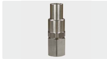
1/4" IG : 1/2" IG. Edelstahl. Max. 350 bar / 90 °C