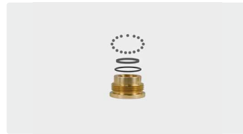
Reparaturatz Drehgelenk ST-351