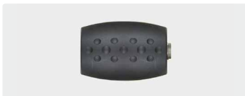
1/4" IG : 1/4" AG. 350 bar. Rostfrei