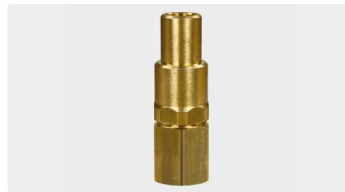
1/4" IG : 1/2" IG. Messing. Max. 250 bar / 90 °C