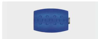
1/4" IG : 1/4" AG. 350 bar. Rostfrei. RAL 5005