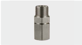
1/2" AG : 1/2" IG. Edelstahl. Max. 350 bar / 90 °C