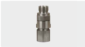
1/2" AG : 1/2" IG. Max. 600 bar