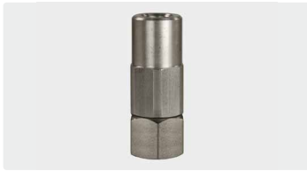
1/4" IG : 3/8" IG. Edelstahl. Drehgelenk mit Radialgleitlager. Max. 350 bar / 90 °C