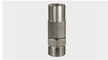
1/4" IG : M22 AG. Edelstahl. Drehgelenk mit Radialgleitlager. Max. 350 bar / 90 °C