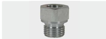
Sechskant. Stahl verzinkt