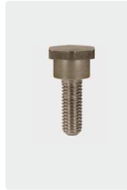
Befestigungsschraube für 1 Kolben