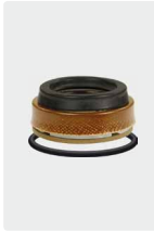
Dichtsatz für 3 Kolben