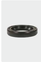
Öldichtungen für 3 Kolben