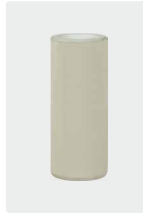
Plungerrohr für 1 Kolben