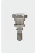
Befestigungsschraube für 1 Kolben