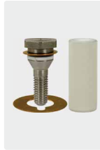
Plungerrohr für 1 Kolben, komplett