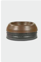
Kolbenringe für 3 Kolben