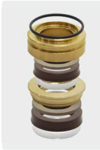
Dichtsatz für 3 Kolben