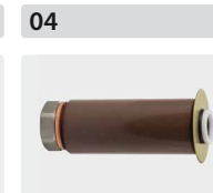
Plungerrohr-Kit für 3 Kolben