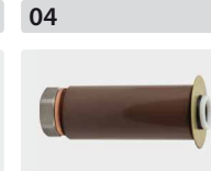
Plungerrohr-Kit für 3 Kolben