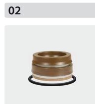
Dichtsätze für 3 Kolben