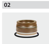
Dichtsätze für 3 Kolben