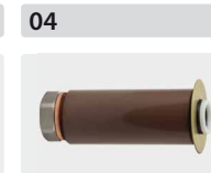
Plungerrohr-Kit für 3 Kolben