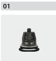
Ventile 6 Stück