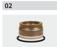
Dichtsätze für 3 Kolben