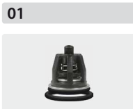
Ventile 6 Stück