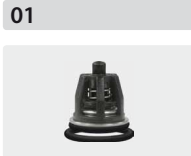
Ventile 6 Stück