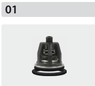
Ventile 6 Stück