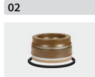
Dichtsätze für 3 Kolben