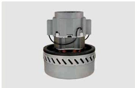
2-stufig. 230 V / 50 Hz. Kabeltyp 2 beigelegt