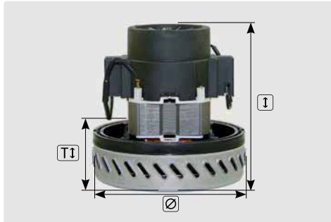
1-stufig. 230 V / 50 Hz. Kabeltyp 3 beigelegt