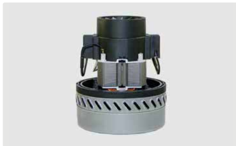
2-stufig. 230 V / 50 Hz. Kabeltyp 3 beigelegt