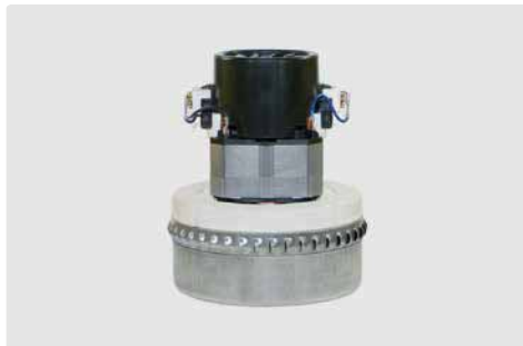
2-stufig. 230 V / 50 Hz. Kabeltyp 1 beigelegt