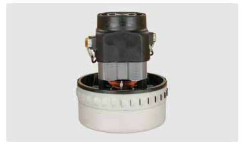
2-stufig. 230 V / 50 Hz. Kabel vorinstalliert. TYP Universal