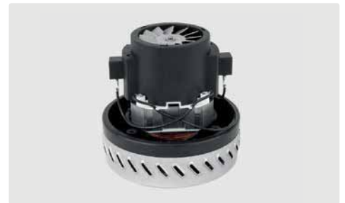
1-stufig. 230 V / 50 Hz. Kabel vorinstalliert