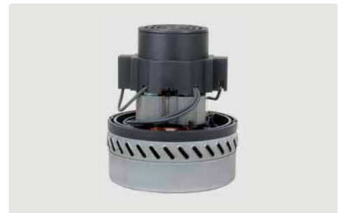
2-stufig. 24 V. Kabel vorinstalliert