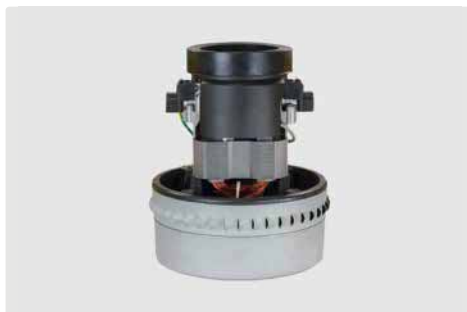
2-stufig. 230 V / 50 Hz. Kabel vorinstalliert