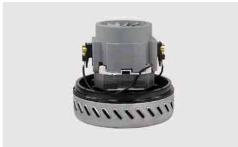
1-stufig. 230 V / 50 Hz. Kabeltyp 2 beigelegt