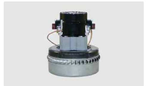
2-stufig. 230 V / 50 Hz. Kabel vorinstalliert