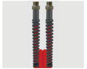
AGR : AGR