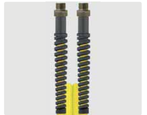
AGR : AGR