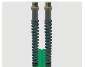
AGR : AGR