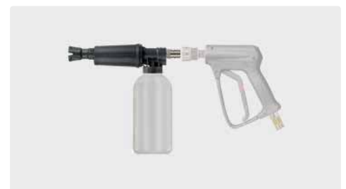
ST-45-250 Edelstahl. Schauminjektorlanze mit Dosierung und Flasche. Max. 300 bar / 80 °C