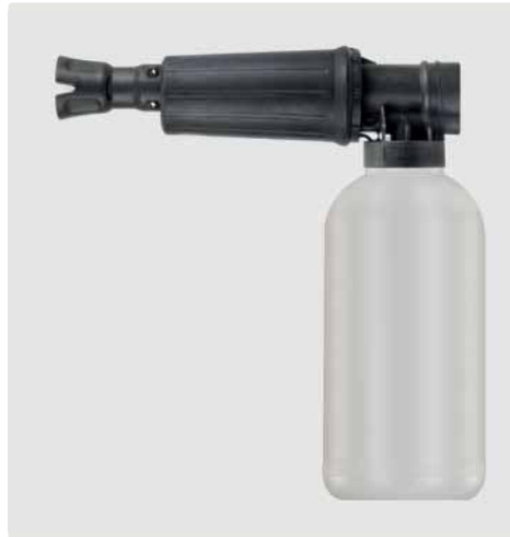
1/4" IG. Schauminjektorlanze mit Dosierung und Flasche. Max. 300 bar / 80 °C