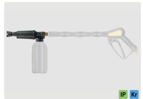
M22 AG. Schauminjektorlanze mit Dosierung und Flasche. Max. 300 bar / 80 °C