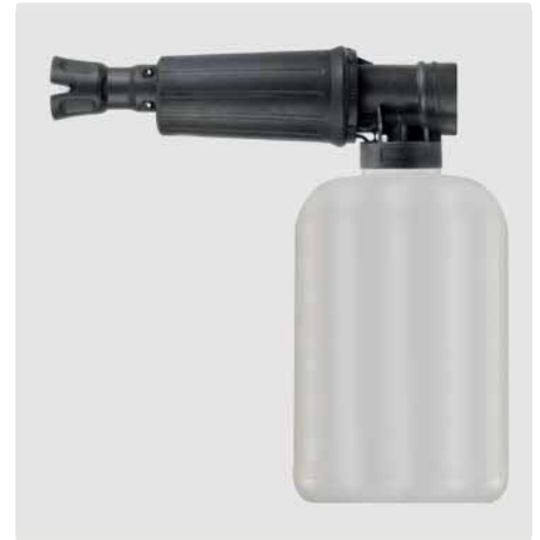
1/4" IG. Schauminjektorlanze mit Dosierung und Flasche. Max. 300 bar / 80 °C