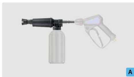
Stecknippel KW. Schauminjektorlanze mit Dosierung und Flasche. Max. 300 bar / 80 °C