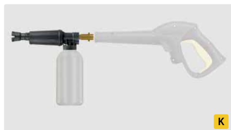
Bayonett K. Messing. Schauminjektorlanze mit Dosierung und Flasche. Max. 300 bar / 80 °C