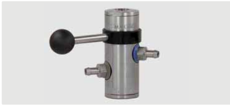
easyfoam365+ Bypass Injektor ST-168 mit Tülle 9 mm und Druckluftmodul (Tülle 9 mm)