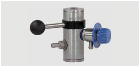
easyfoam365+ Bypass Injektor ST-168 mit Dosier-ventil ST-161 und Druckluftmodul (Tülle 9 mm)