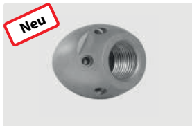
3/8" IG. 6x 75° +1x 0°. 25-70 l/min. Für \text{R} \text{D} 75-150 mm. Außen \text{D} 35 mm. \text{G} 207 g.