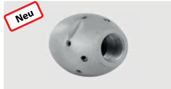
1/2" IG. 6x 75° 3x 30° +1x 0°. 80-140 l/min. Für \text{R} \text{D} 120-250 mm. Außen \text{D} 40 mm. \text{G} 630 g.