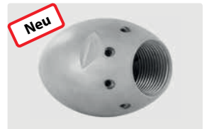
1" IG. 8x 75° +1x 0°. 100-250 l/min. Für \text{R} \text{D} 150-300 mm. Außen \text{D} 62 mm. \text{G} 1.265 g.