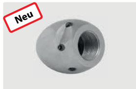
1/2" IG. 6x 75° +1x 0°. 30-100 l/min. Für \text{R} \text{D} 100-200 mm. Außen \text{D} 40 mm. \text{G} 281 g.