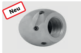
3/4" IG. 6x 75° +1x 0°. 30-100 l/min. Für \text{R} \text{D} 120-250 mm. Außen \text{D} 50 mm. \text{G} 567 g.