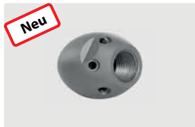
1/4" IG. 6x 75° +1x 0°. 20-50 l/min. Für \text{R} \text{D} 50-100 mm. Außen \text{D} 30 mm. \text{G} 127 g.