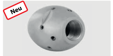
3/4" IG. 6x 75° 3x 30° +1x 0°. 100-250 l/min. Für \text{R} \text{D} 150-300 mm. Außen \text{D} 50 mm. \text{G} 1.367 g.