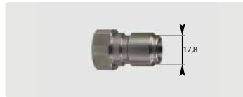
Stecknippel : IG. Edelstahl. Max. 250 bar / 150 °C