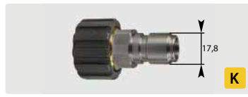
Stecknippel : IG. Edelstahl + Messing. Max. 250 bar / 150 °C