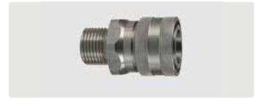
Kupplung : AG. Edelstahl. 60° Dichtkonus. Max. 250 bar / 150 °C