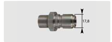
Stecknippel : AG. Edelstahl. 60° Dichtkonus. Max. 250 bar / 150 °C