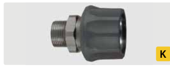
Kupplung : AG. Edelstahl. Max. 250 bar / 150 °C