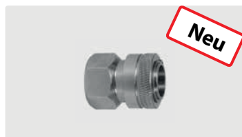
Kupplung : IG. Edelstahl. Max. 150 bar / 90 °C