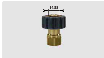
HV M22 : IG. Max. 400 bar / 150 °C