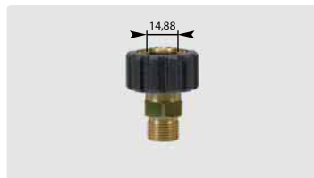
HV M22 : AG. Max. 400 bar / 150 °C