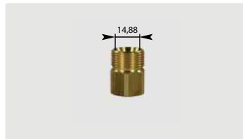
M22 : IG. Max. 400 bar / 150 °C