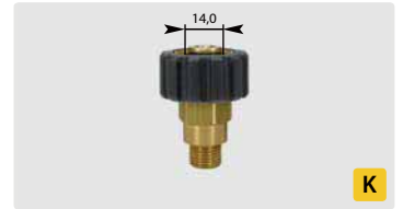
HV M22 : AG. Max. 400 bar / 150 °C