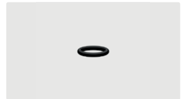
O-Ring. Handverschraubung US. 10,77 x 2,62. NBR 70