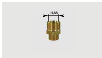
M22 : AG. Max. 400 bar / 150 °C