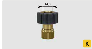
HV M22 : IG. Max. 400 bar / 150 °C