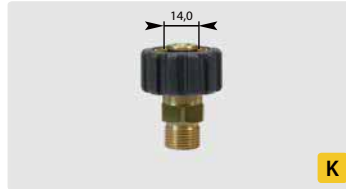
HV M22 : AG. Max. 400 bar / 150 °C