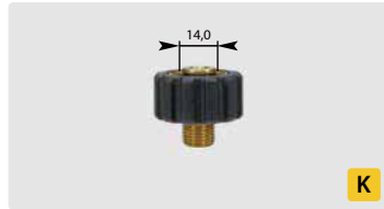
HV M22 : AG. Max. 400 bar / 150 °C