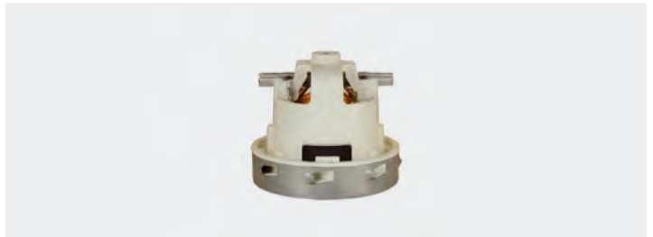
1-stufig. 230 V / 50 Hz. Ohne Kabel, (Kabeltyp 1 optional)