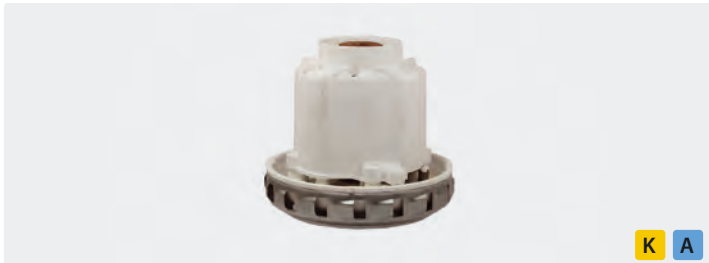
1-stufig. 230 V / 50 Hz. Kabeltyp 1 beigelegt