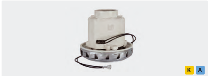
1-stufig. 230 V / 50 Hz. Kabel vorinstalliert