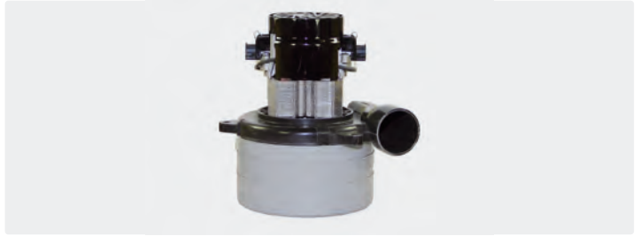
3-stufig mit Abluftrohr. Kabel vorinstalliert. 262 064 113 : 24 V. 262 074 113 : 36 V