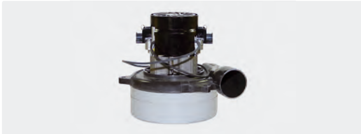
2-stufig mit Abluftrohr. 24 V. Kabel vorinstalliert