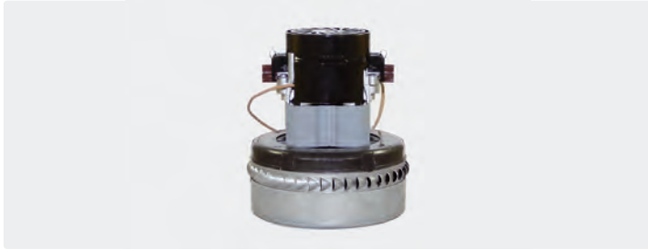
2-stufig. 230 V / 50 Hz. Kabel vorinstalliert