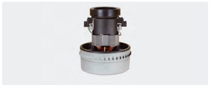
2-stufig. 230 V / 50 Hz. Kabel vorinstalliert