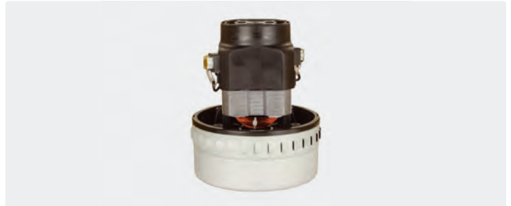
2-stufig. 230 V / 50 Hz. Kabel vorinstalliert.