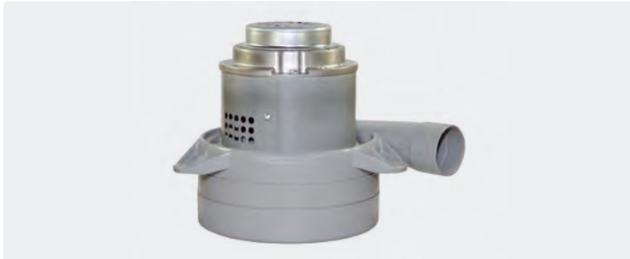
3-stufig mit Abluftrohr. 230 V / 50 Hz. Kabel vorinstalliert