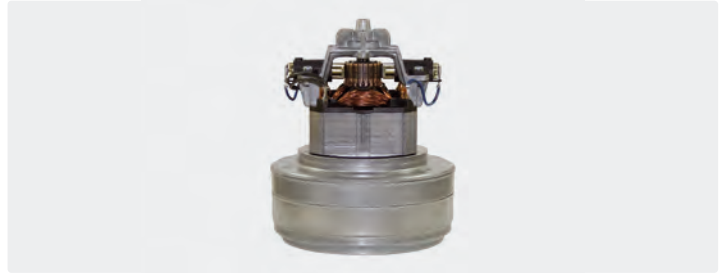
2-stufig. 230 V / 50 Hz. Kabel vorinstalliert