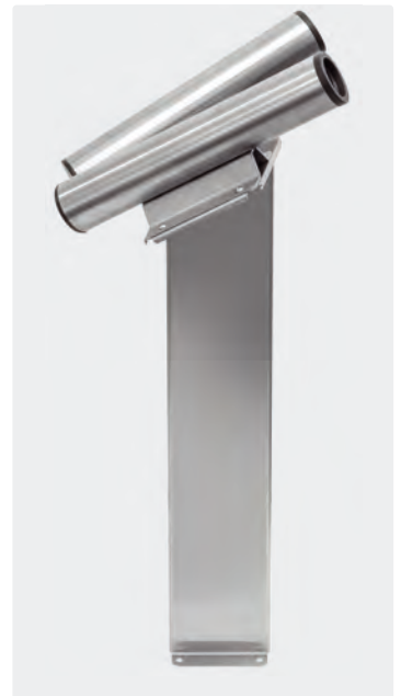
Zweifach-Fugendüsenaufnahme auf Säule. inkl. Adapterplatte. Edelstahl