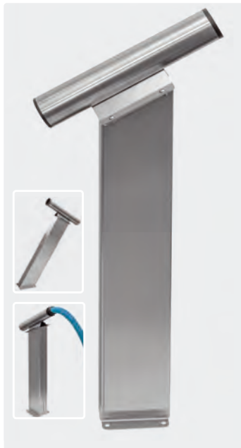
Fugendüsenaufnahme auf Säule für Bodenbefestigung. Edelstahl