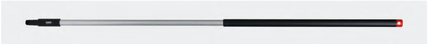
Alustiel. Ergonomischer Stiel mit isoliertem Griff