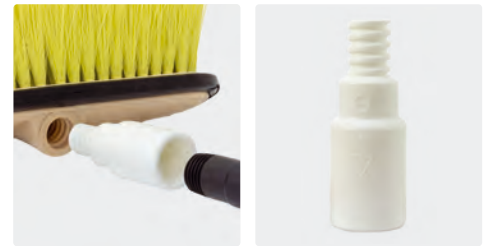
Adapter für Lanzen ohne Kordelgewinde. Kordelgewinde AG : Gewinde IG