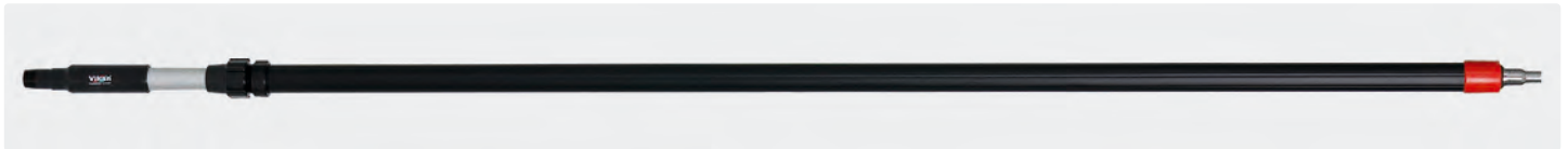
Alustiel. Teleskopstiel mit isoliertem Griff. Schlauchtülle passend für 1/2" und 3/4" Schlauch