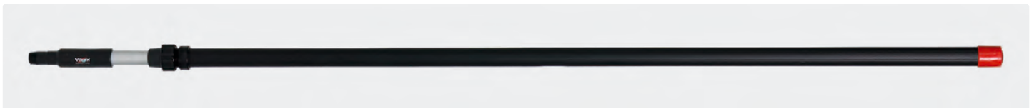
Alustiel. Teleskopstiel mit isoliertem Griff