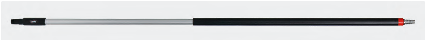
Alustiel. Ergonomischer Stiel mit isoliertem Griff. Schlauchtülle passend für 1/2" und 3/4" Schlauch