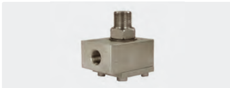
1/4" IG : 3/8" AG. DN 6. Gehäuse und Achse Edelstahl. Max. 600 bar / 90 °C