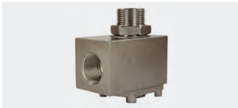
3/4" IG : 3/4" AG. DN 19. Gehäuse und Achse Edelstahl. Max. 200 bar / 90 °C