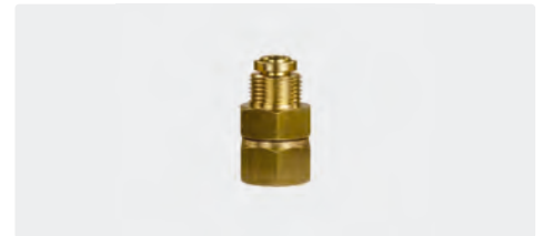
3/8" AG : 3/8" IG. Messing. Max. 220 bar / 90 °C