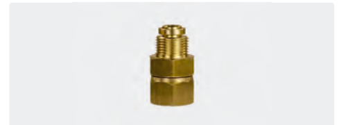
3/8" AG : 1/4" IG. Messing. Max. 220 bar / 90 °C