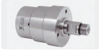
DYT. Max. 350 bar

Achse und Gehäuse Edelstahl. 4-fach gelagert. Wartungsfrei. DN 6. Anwendungsbereich: Speziell für hohe Drehzahlen und selbstrotierende Anwendungen konzipiert. Max. 2.000 U/min / 120 °C