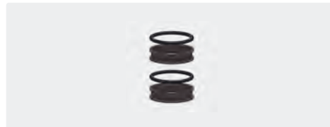
Dichtsatz Drehgelenk 750 280 0