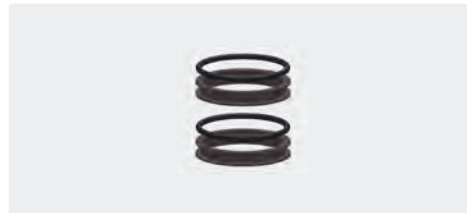
Dichtsatz Drehgelenk 750 400 1