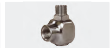
1/2" IG : 1/2" AG. DN 12. Max. 30 U/min / 90 °C