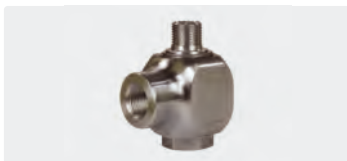
3/8" IG : 3/8" AG. DN 10. Max. 30 U/min / 90 °C