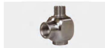
1/2" IG : 1/2" AG. DN 12. Max. 30 U/min / 90 °C