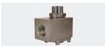
3/4" IG : 3/4" AG. DN 19. Max. 200 bar / 90 °C