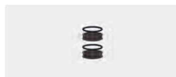
Dichtungsset Drehgelenk 750 400 1