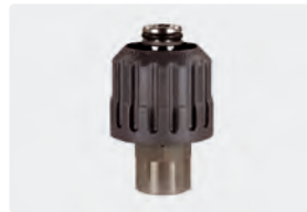
HV M24 : IG. Max. 700 bar / 150 °C