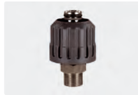
HV M24 : AG. Max. 700 bar / 150 °C