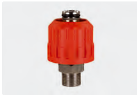
HV M24 : AG. Max. 700 bar / 150 °C