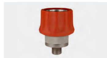
Kupplung : AG. Edelstahl. Max. 600 bar / 150 °C