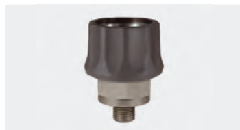
Kupplung : AG. Edelstahl. Max. 600 bar / 150 °C