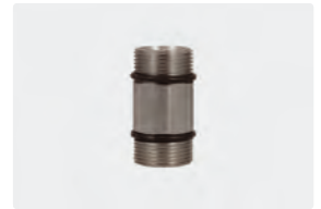
M24 AG : M24 AG. Max. 700 bar / 150 °C