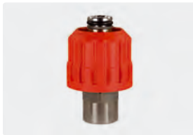
HV M24 : IG. Max. 700 bar / 150 °C