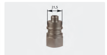
Stecknippel : IG. Edelstahl. Max. 600 bar / 150 °C