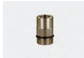
IG : M24 AG. Max. 700 bar / 150 °C