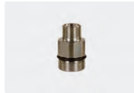
AG : M24 AG. Max. 700 bar / 150 °C