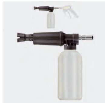
ST-247. Schauminjektorlanze mit Dosierung und Flasche. Max. 300 bar / 80 °C