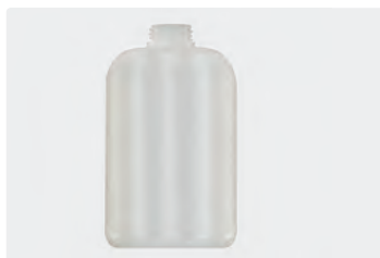
Ersatzflasche 2 Liter