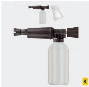
HV M22 drehbar. Schauminjektorlanze mit Dosierung und Flasche. Max. 300 bar / 80 °C