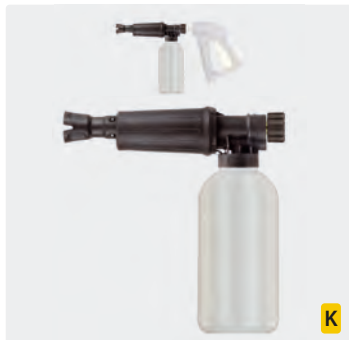
HV M22. Schauminjektorlanze mit Dosierung und Flasche. Max. 300 bar / 80 °C