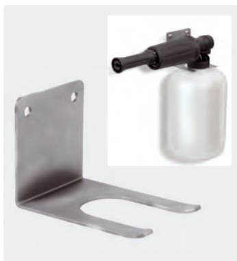
Wandhalter. Edelstahl. 68 mm x 95 mm. Inkl. Befestigungsmaterial