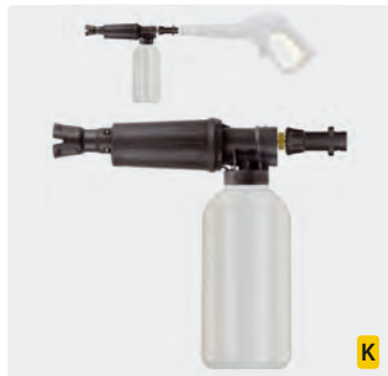
Bajonett K. Kunststoff. Schauminjektorlanze mit Dosierung und Flasche. Max. 180 bar / 80 °C