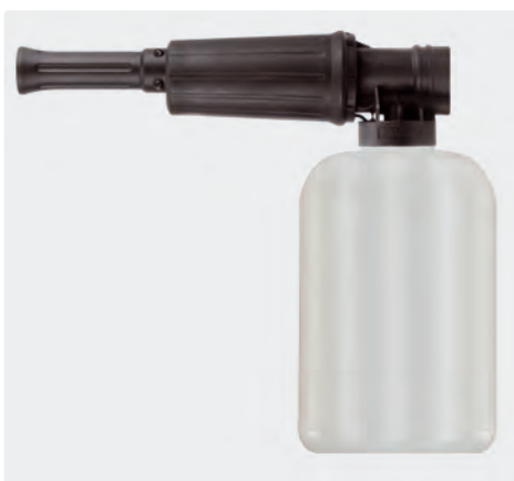
1/4" IG. Schauminjektorlanze mit Dosierung und Flasche. Ohne Pad. Max. 300 bar / 80 °C

Verlieren Sie keine Zeit und testen Sie unsere Neuheit so schnell wie möglich!