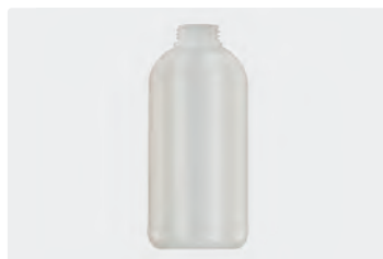
Ersatzflasche 1 Liter