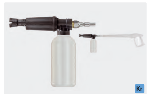
Stecknippel KR. Schauminjektorlanze mit Dosierung und Flasche. Max. 300 bar / 80 °C