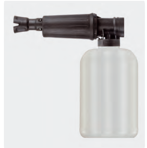
1/4" IG. Schauminjektorlanze mit Dosierung und Flasche. Max. 300 bar / 80 °C