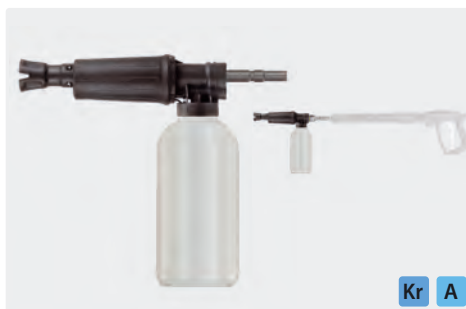
Stecknippel KW. Schauminjektorlanze mit Dosierung und Flasche. Max. 300 bar / 80 °C