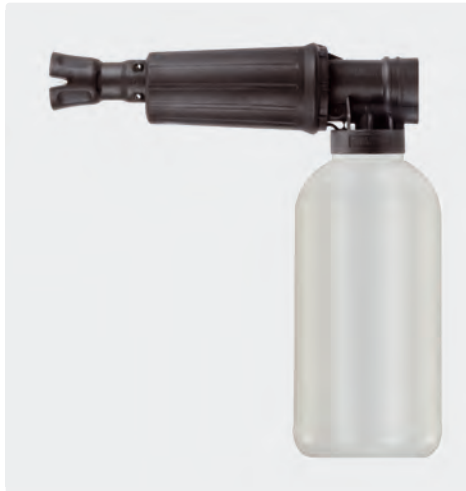
1/4" IG. Schauminjektorlanze mit Dosierung und Flasche. Max. 300 bar / 80 °C