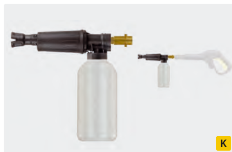
Bajonett K. Messing. Schauminjektorlanze mit Dosierung und Flasche. Max. 300 bar / 80 °C