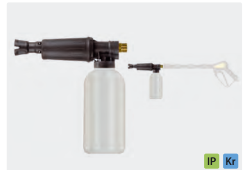
M22 AG. Schauminjektorlanze mit Dosierung und Flasche. Max. 300 bar / 80 °C