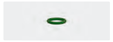
O-Ring. 10x2. Viton