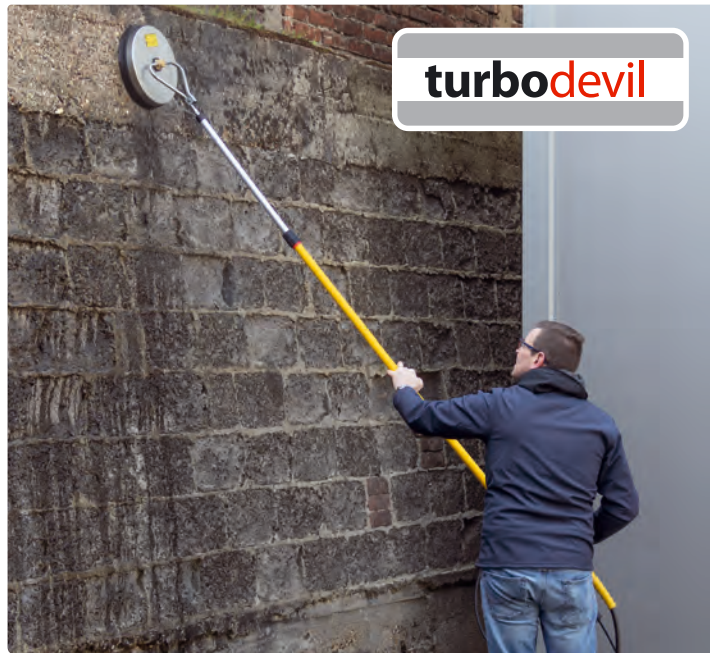
Wandhalterung für Wandreiniger turbo devil WW 301