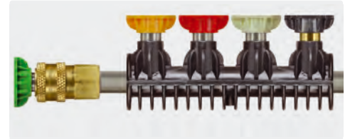
Düsenhalter für Schnellwechsdüsen. Passend für 1/4" Strahlrohre. Lieferung ohne Zubehör