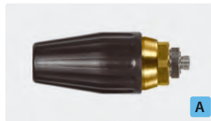
1/8" AG. Spritzwinkel 20°. 100 - 250 bar. Max. 100 °C