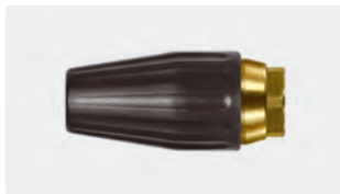
1/4" IG. Spritzwinkel 20°. 100 - 250 bar. Max. 100 °C