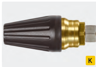
M18 IG. Spritzwinkel 20°. 200 - 400 bar. Max. 100 °C