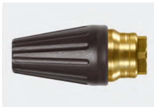
1/4" IG. Spritzwinkel 20°. 200 - 400 bar. Max. 100 °C