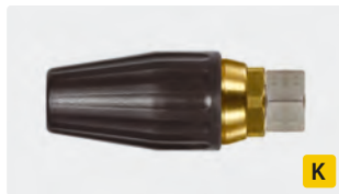
M18 IG. Spritzwinkel 20°. 100 - 250 bar. Max. 100 °C