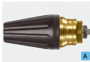
1/8" AG. Spritzwinkel 20°. 200 - 400 bar. Max. 100 °C