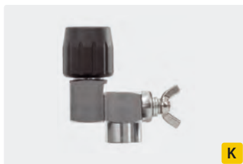
Edelstahl. Feststellbar. Max. 310 bar / 45 l/min / 150 °C