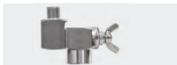
Edelstahl. Feststellbar. Max. 310 bar / 45 l/min / 150 °C