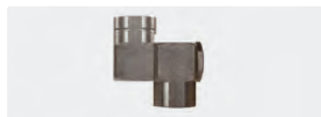
Edelstahl. Max. 310 bar / 45 l/min / 150 °C