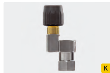
Edelstahl. Max. 310 bar / 45 l/min / 150 °C