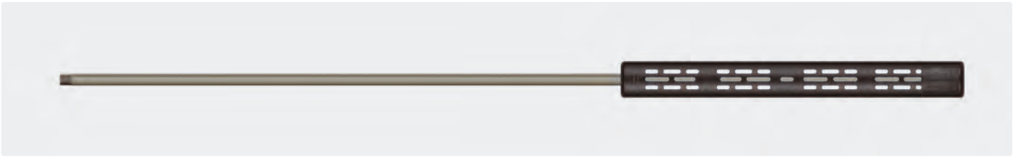
1/4" AG. Strahlrohr mit Isolierung ST-9. Max. 400 bar / 150 °C