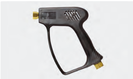
ST-1500 ohne Ventil (Freifluss)

Professionelle Pistole ohne Ventil (Freifluss). Max. 275 bar / 45 l/min / 150 °C