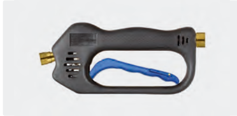
ST-601 Linear Frostschutz

Frostschutzausführung. Max. 275 bar / 45 l/min / 150 °C