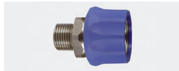
Kupplung : AG. Edelstahl. 60° Dichtkonus. Max. 250 bar / 150 °C