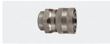
Kupplung : IG. Edelstahl. Max. 250 bar / 150 °C