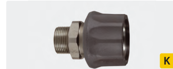
Kupplung : AG. Edelstahl. Max. 250 bar / 150 °C