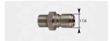
Stecknippel : AG. Edelstahl. 60° Dichtkonus. Max. 250 bar / 150 °C