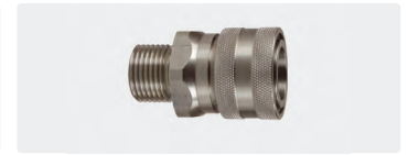
Kupplung : AG. Edelstahl. 60° Dichtkonus. Max. 250 bar / 150 °C