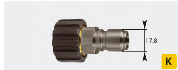
Stecknippel : IG. Edelstahl + Messing. Max. 250 bar / 150 °C