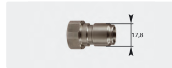
Stecknippel : IG. Edelstahl. Max. 250 bar / 150 °C