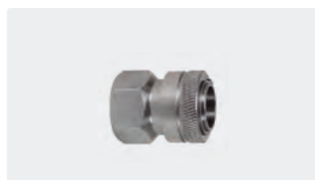
Kupplung : IG. Edelstahl. Max. 150 bar / 90 °C