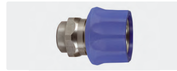
Kupplung : IG. Edelstahl. Max. 250 bar / 150 °C