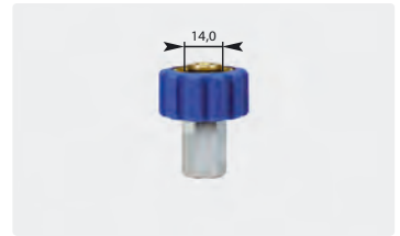
Standard 1/2" : IG. Blau. Max. 400 bar / 150 °C