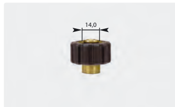
Kurz M22 : IG. Schwarz. Max. 400 bar / 150 °C