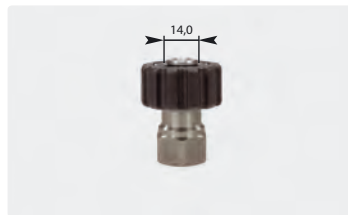
M22 : IG. Edelstahl. Max. 500 bar