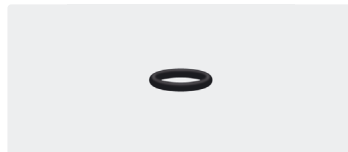
O-Ring. 10x2. Perbunan