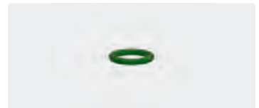
O-Ring. 10x2. Viton