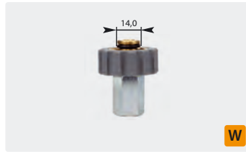
Standard M21: IG. Grau. Max. 400 bar / 150 °C