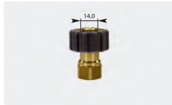
Standard M22 : IG. Schwarz. Max. 400 bar / 150 °C