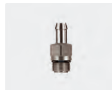
Tülle 9 mm : M14 AG. Rückschlagventil