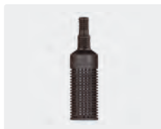
Filter ohne Rückschlagventil. Kunststoff. Gewicht Edelstahl