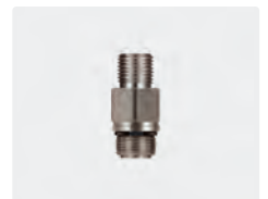
1/4" AG : M14 AG. Rückschlagventil