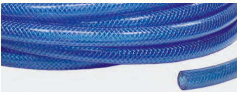
Max. 60 °C. Andere Abmessungen auf Anfrage