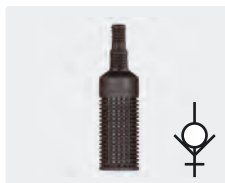
Filter mit Rückschlagventil. Kunststoff. Gewicht Edelstahl