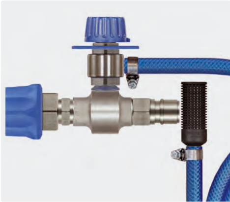
Kupplung ST-45-250 Edelstahl : Stecknippel ST-45-250 Edelstahl. Injektor mit Dosierventil ST-161, Saugschlauch 2.000 mm und Saugfilter ST-31. Max. 250 bar / 90 °C