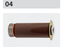
Plungerrohr-Kit für 3 Kolben