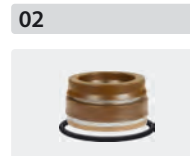
Dichtsätze für 3 Kolben