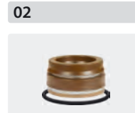
Dichtsätze für 3 Kolben