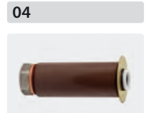
Plungerrohr-Kit für 3 Kolben