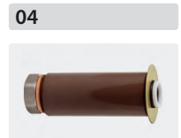
Plungerrohr-Kit für 3 Kolben