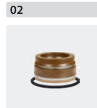
Dichtsätze für 3 Kolben