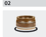
Dichtsätze für 3 Kolben