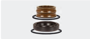
Dichtsätze für 3 Kolben