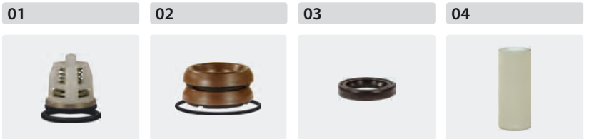
Ventile 6 Stück Dichtsätze für 3 Kolben Öldichtungssatz (7-teilig) Plungerrohre für 3 Kolben