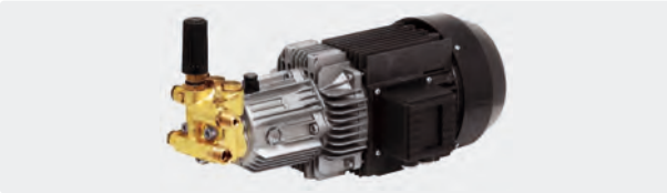
Pumpe mit Umlaufventil* und Injektor. Volt 400/50 Hz (170 204 20), Volt 230/50 Hz (170 204 15)