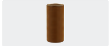
Plungerrohr Set, 3 Stück