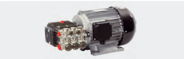
Motorpumpe ohne Umlaufventil. Volt 400/50Hz