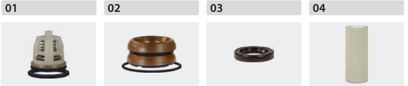
Ventile 6 Stück Dichtsätze für 3 Kolben Öldichtungssatz (5-teilig) Plungerrohre für 3 Kolben