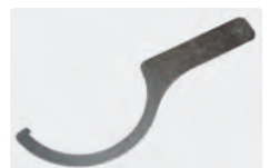
Für Messing Kopf. Für 3-teilige Filtertassen