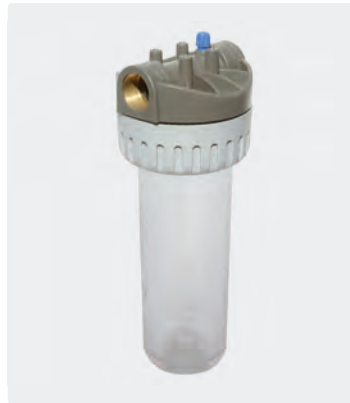
3-teilig. Entlüftungsstopfen. Innengewinde Messing. Max. 10 bar / 40 °C