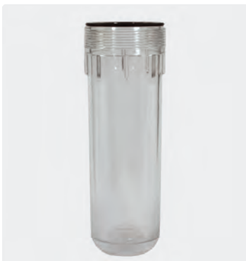
Filter 2-teilig. Kunststoff. Max. 50 °C