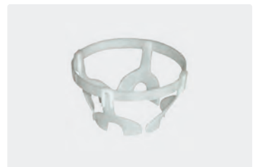
Für Montage. Zentrierhilfe