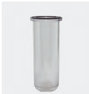
Filter 3-teilig. Kunststoff. Max. 40 °C