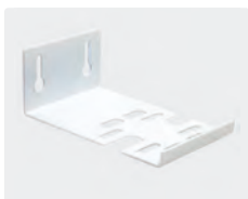
Einzel. Stahl weiß pulverbeschichtet