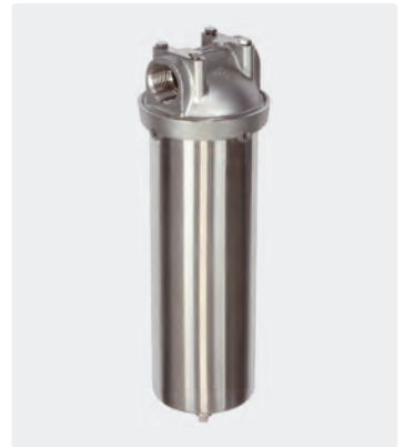
3-teilig. Mit Wandhalter, Spannstift und Entlüftungsstopfen. Max. 20 bar / 120 °C