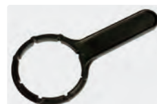
Für Kunststoff Kopf. Für 2-teilige Filtertassen