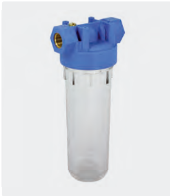
2-teilig. Entlüftungsstopfen. Innengewinde Messing. Max. 10 bar / 50 °C