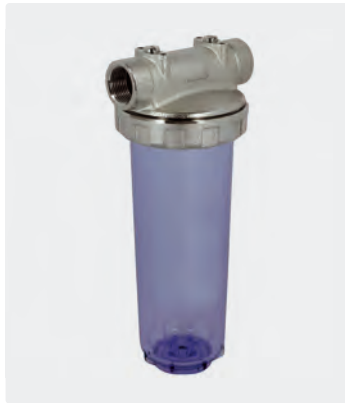
3-teilig. Entlüftungsstopfen. Kopf Messing vernickelt. Tasse Kunststoff. Max. 15 bar / 40 °C