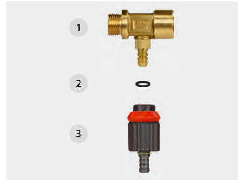
Min. 2 bar - max. 10 bar. Durchfluss bei 2 bar ca. 150 l/h. Zumischung ca. 0 - 11,5 %