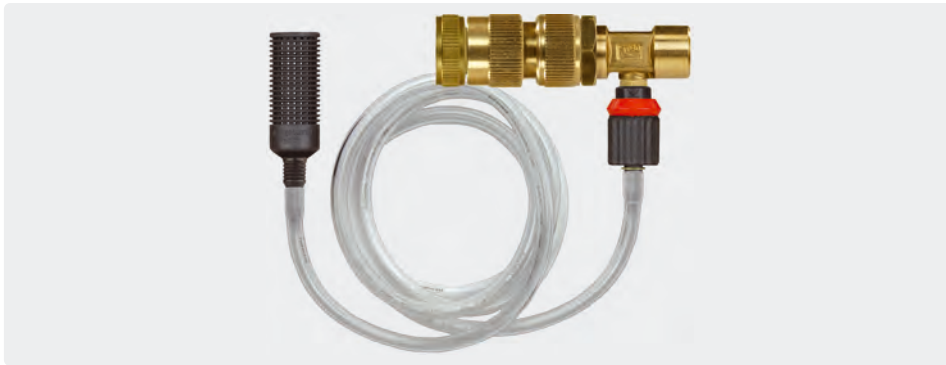
Injektor mit Dosierung. Saugschlauch 1 m. Ansaugfilter ST-31. Min. 2 bar - max. 10 bar