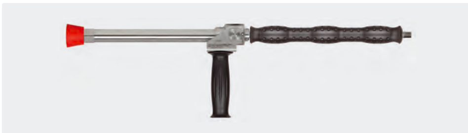
1/4" AG. Edelstahl. Weitwurflanze 350 mm mit Isolierung ST-29 Cool & Compact 330 mm, seitlichem Handgriff und Düsenschutz aus Kunststoff ohne Düse. Max. 280 bar / 130 l/min / 100 °C