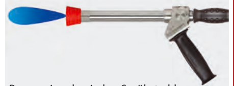
Progressiver, konischer Sprühstrahl