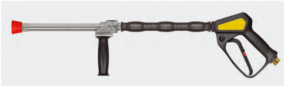
3/8" IG. Edelstahl. Weitwurflanze 350 mm mit Isolierung ST-29 Cool & Compact 330 mm, Pistole ST-2300, seitlichem Handgriff und Düsenschutz aus Kunststoff ohne Düse. Max. 280 bar / 45 l/min / 100 °C