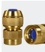
Messing. Mit Spannschraube

Premium Qualität. Schlauchkupplungen mit 6 Edelstahlkugeln.