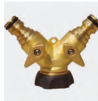
IG. Messing + Gummi. 2 regelbare Ausgänge