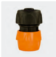
Kunststoff. Mit Spannschraube