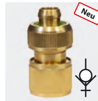
Messing. Mit Spannschraube + Wasserstopp