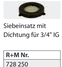
R+M Nr. 728 250