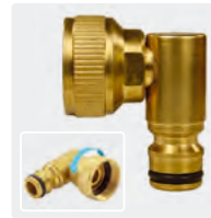
IG. Messing. Winkeldrehgelenk. Mit Flachdichtung