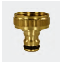
IG. Messing. Mit Flachdichtung