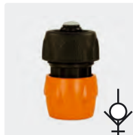
Kunststoff. Mit Spannschraube + Wasserstopp