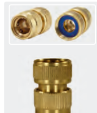
3/4" IG. Messing. Mit Flachdichtung