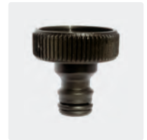
IG. Kunststoff. Mit Flachdichtung