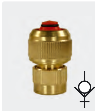
Messing. Mit Spannschraube + Wasserstopp