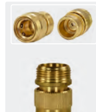
3/4" AG. Messing