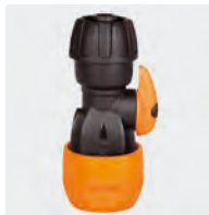
Kunststoff. Mit Spannschraube + Absperrhahn