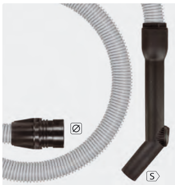
(265 054 + 263 253)