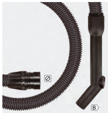
(265 054 + 263 653)