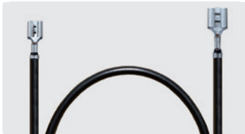
Flachhülse 6,3 : Flachhülse 4,8. Kabel 500 mm.