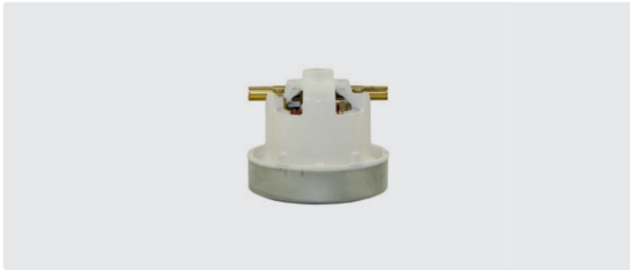
1-stufig. 230 V / 50 Hz. Ohne Kabel, (Kabeltyp 1 optional)