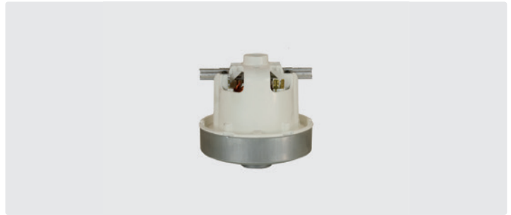
1-stufig. 230 V / 50 Hz. Ohne Kabel, (Kabeltyp 1 optional)